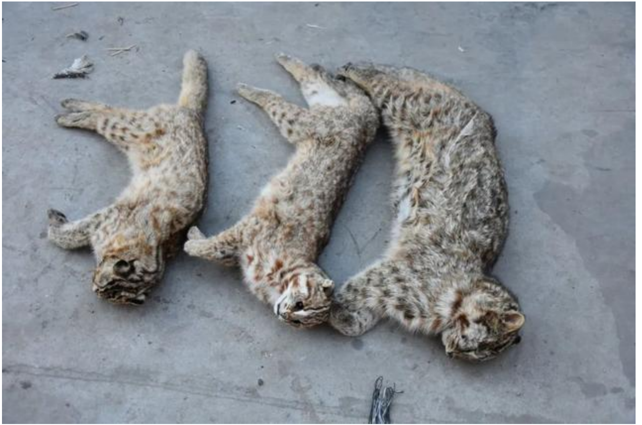
从犯罪嫌疑人刘某某家中扣押豹猫 3 只